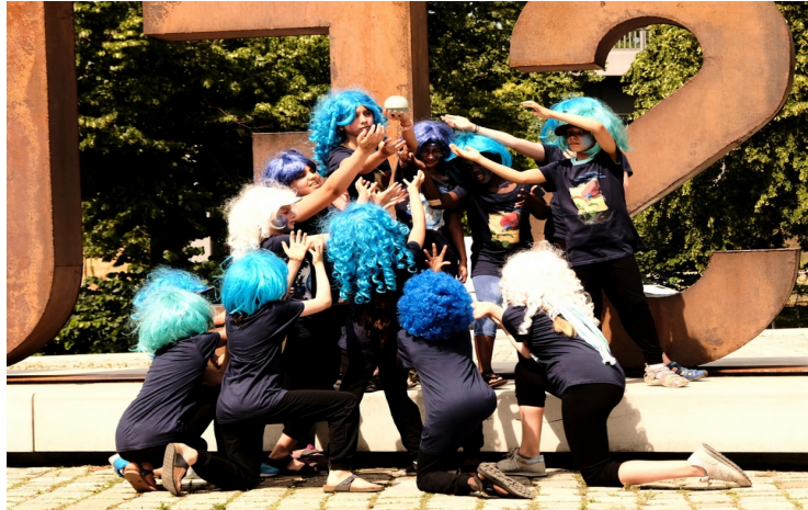
Liquid City 2019 – Nähe & Gemeinsamkeit sind Geschichte ?!